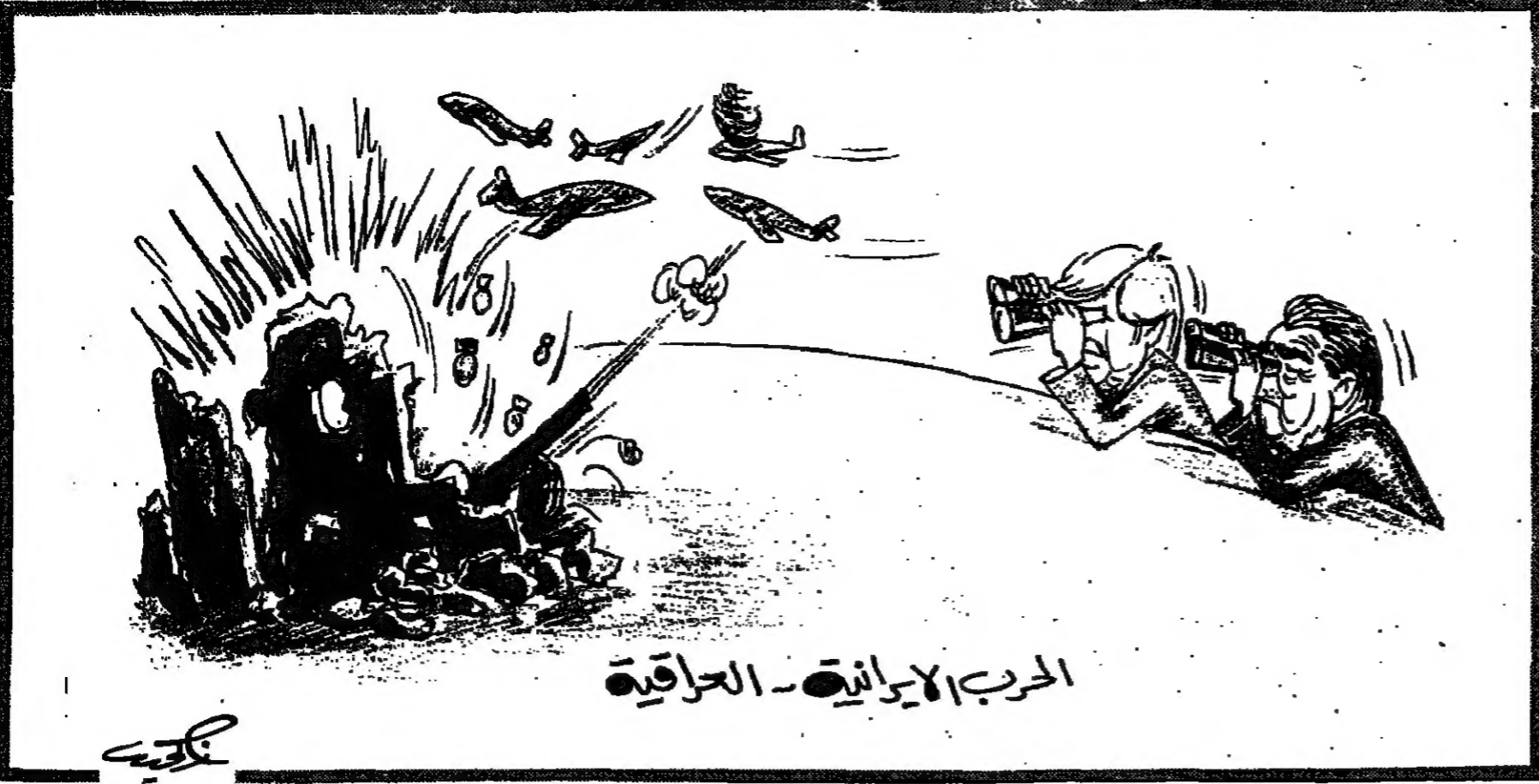
الحرب الإيرانية - العراقية

ان احتلال قطاع من ايران واحتلاله من جاب العراق قد يسم الملائكة في